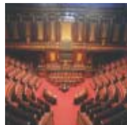
In alto: l' Aula delle Sedute

Centrale della Repubblica franco-romana; nella seconda metà del XIX secolo Pio IX Mastai Ferretti vi accolse il Ministero delle finanze e