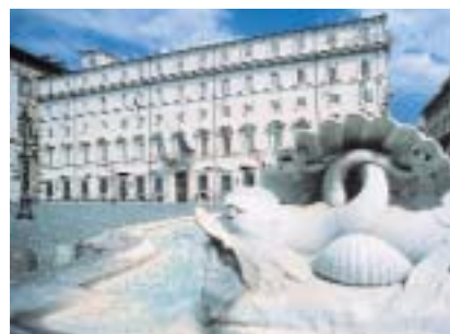
In basso: la facciata su Piazza Colonna