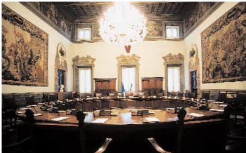
In basso: il Salone del Consiglio

Nell'eseguire l'ambizioso progetto, che prevedeva anche un arioso coronamento a giorno al posto del vecchio tetto a spioventi e una nuova altana, che doveva superare in altezza quella del prospiciente Palazzo Ludovisi, si rinunciò alla sistemazione dell'angolo del cortile costruito dal cardinale Deti. Ciò, infatti, avrebbe portato a lavori di demolizione troppo costosi così che le ampie finestre alternate a raffinati disegni a stucco che caratterizzano il cortile, oggi si interrom-