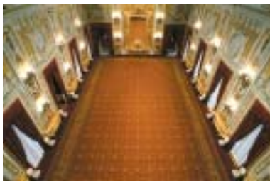
A sinistra: il Salone delle Feste

Nel Salone dei Corazzieri, ad esempio, si svolge la cerimonia di insediamento del Presidente della Repubblica mentre nel Salone delle Feste ha luogo la cerimonia di giuramento del Governo e vengono offerti i pranzi in occasione delle visite di Stato. Nello Studio alla Vetrata si tengono i colloqui con capi di stato e autorità straniere e la Loggia d'Onore della Palazzina