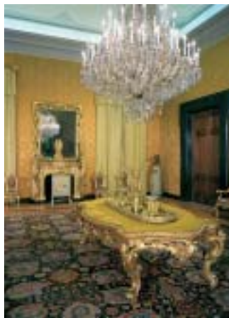
In basso a sinistra: la Sala Gialla

Nel 1870, in seguito all'unità d'Italia, si decise di destinare il palazzo di Montecitorio a sede della Camera dei Deputati, preferendolo alle alternative del Campidoglio o di Palazzo Venezia. In tale occasione si decise di trasformare il cortile in Aula dell'Assemblea, secondo un progetto realizzato dall'ingegnere Paolo Comotto che concepì una gradinata semicircolare poggiante su un'intelaiatura in ferro e legno ricoperta di zinco. Ma le trasformazioni di Comotto non risultarono sufficienti e così, all'inizio del XX