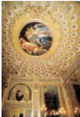
In alto: il Salone d'Oro con l'ovale raffigurante Diana ed Endimione

zazione dell'area dove si era svolta la cerimonia di cremazione degli imperatori, presumibilmente Antonino Pio e Marco Aurelio.