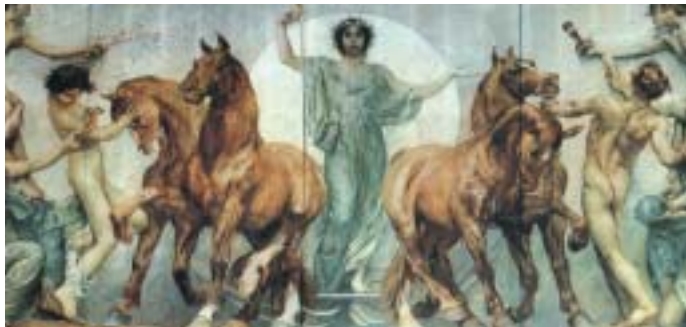
In alto: G. A. Sartorio, un particolare del fregio pittorico raffigurante "La Civiltà, la Virtù e la Storia del Popolo Italiano"

Palazzo Montecitorio nei giorni feriali (escluso il sabato) previa