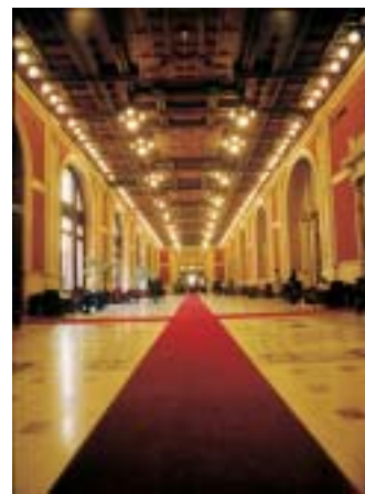
A destra: il corridoio prospiciente l'Aula detto "Transatlantico"

secolo, fu deciso l'ampliamento della costruzione affidando il progetto all'architetto siciliano Ernesto Basile. Rispettando appieno il gusto liberty dell'epoca, Basile realizzò un nuovo edificio, alle spalle di quello