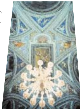
In alto: la volta della Sala dei Mappamondi

La palazzina venne realizzata da Alessandro Algardi, su committenza del cardinale Camillo Pamphilj, a partire dal 1644. L'edificio, noto anche come Casino del Belrespiro per la posizione elevata, o Casino delle Statue, per la ricca raccolta di marmi antichi che ospitava, è stato di recente sottoposto ad un importante restauro che ha rivelato la delicata cromia originaria della facciata e degli stucchi che ornano gli