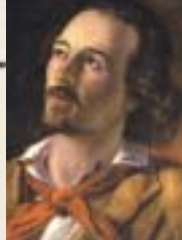
Goffredo Mameli (Genova, 1827 - Roma, 1849) autore dei versi dell'Inno Nazionale