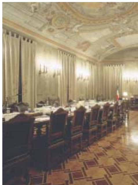
In basso: la Sala Pannini