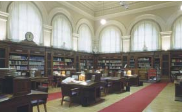
Sopra: la Biblioteca

Sant'Eustachio, e altre due inserite nel 1666 nel pronao del Pantheon,