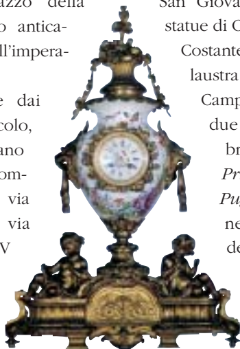
Al centro: orologio in porcellana francese

nità fluviali poste alla base del Palazzo Senatorio in Campidoglio, la statua di Costantino nell'atrio di San Giovanni in Laterano, le statue di Costantino e del figlio Costante collocate sulla balaustra della cordonata del Campidoglio e, infine, le due preziose sculture bronzee raffiguranti il Principe Ellenistico e il Pugile , oggi custodite nell'Aula Ottagona delle Terme di Diocleziano.