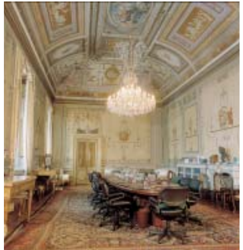
In alto: il Salone Pompeiano

conto, inoltre, della ristrettezza del terreno e della forma trapezoidale del lotto sul quale innalzare il palazzo che, oltre la congregazione cardinalizia, doveva ospitare anche la Segnatura dei Brevi, ufficio che provvedeva alla stesura delle lettere del pontefice in merito a indulgenze e dispense, e due corpi militari: i Cavalleggeri e le Corazze. I primi, cavalieri dall'armatura leggera, costituivano la guardia a cavallo del pontefice mentre il corpo delle Corazze scortava a piedi la carrozza papale. Ferdinando Fuga concepì un palazzo, anch'esso di forma trapezoidale, in grado di risolvere il problema statico e con 7 piani indipendenti da assegnare alle singole istituzioni ospitate. Al piano seminterrato si trovavano le cantine e le scuderie, al piano terra i quartieri dei corpi di guardia e le cucine, al primo mezzanino gli alloggi per i militari e nell'attico le abitazioni dei graduati. Il piano nobile fu occupato invece dagli appartamenti del cardinale dei Brevi e del cardinale della Sacra Consulta: assolutamente identici e simmetrici, gli appartamenti erano composti da alcune sale di rappresentanza, prospicienti la piazza del Quirinale e da ambienti destinati ad abitazione dei prelati. Gli ultimi