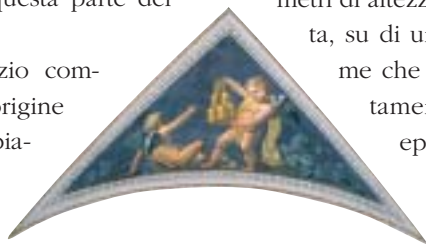
Al centro: una lunetta della volta della Sala dei Mappamondi

nel medioevo e sostituita da Sisto V nel 1589 con la statua di San Paolo. La colonna sorgeva probabilmente al centro di un'area porticata ed era strettamente connessa con il tempio, collocato immediatamente a ovest, che il senato romano aveva eretto in onore di Marco Aurelio divinizzato. Nelle vicinanze sono stati rinvenuti anche i resti di due ustrina , recinti che costituivano la monumentaliz-