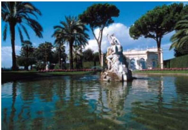
A destra: uno scorcio dei giardini con la "Fontana di Caserta"

Il nucleo originario del Palazzo del Quirinale è da individuare in una "vigna" che, alla fine del Quattrocento, risultava essere di proprietà della nobile famiglia Carafa. Il cardinale Oliviero Carafa che aveva raccolto una preziosa collezione antiquaria, formata da statue antiche, rilievi e iscrizioni, vi ospitava i suoi amici letterati. Nel 1550 la villa venne data in affitto al cardinale Ippolito d'Este, grazie al quale venne avviata una generale trasformazione del complesso che